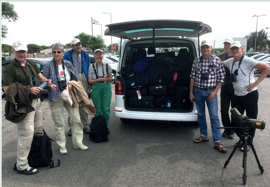
Redo för Algarve!

I en vecka botaniserade vi i Sagres, på stäppen vid Castro Verde och i Ria Formosa vid Tavira.