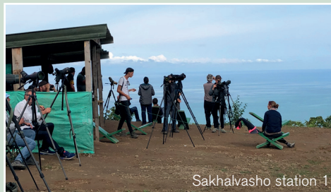
Sakhalvasho station 1

Uppe vid Poti kunde vi beskåda några tumlare också men även gigantiska flasknosdelfiner ( Tursiops truncatus ) som hoppade upp ur vattnet ganska nära stranden. På svenska heter de även Öresvin.