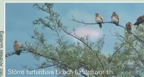
Större turturduva t.v. och turturduvor t.h.

Skräntärna, 2 ex 27/9, 1 ex 30/9 Bredstjärtad labb, 1 ex 1/10 Kustlabb, 2 ex 27/9, 2 ex 28/9, 8 ex 1/10 Tamduva, observerad de flesta dagar Skogsduva, 20 ex 28/9, 15 ex 29/9, 41 ex 30/9, 7 ex 1/10, 20 ex 3/10 Ringduva, 1 ex 30/9-2/10, 3 ex 3/10 Turturduva, 50 ex 27/9, 8 ex 28/9, 36 ex 29/9, 1 ex 30/9, 4 ex 1/10