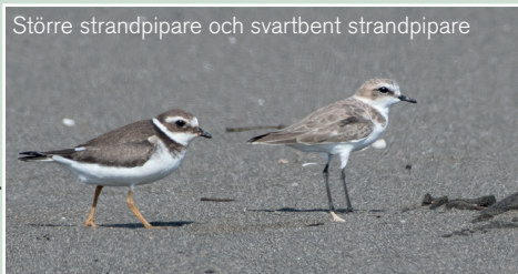
Större strandpipare och svartbent strandpipare

Mindre sumphöna, 2 ex 1/10 Gråhuvad purpurhöna, 1 ex 1/10 Rörhöna, 5 ex 30/9, 15 ex 1/10, 4 ex 3/10 Sothöna, 20 ex 1/10, 8 ex 3/10 Skärfläcka, 4 ex 27/9 Stytlöpare, 3 ex 27/9 Mi strandpipare, 2 ex 30/9, 1 ex 1/10 St strandpipare, 20 ex 30/9, 10 ex 1/10, 10 ex 3/10