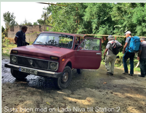
Sista biten med en Lada Niva till Station 2

Skrikörnar av båda arterna, stjäppörnar och ormörnar . Framåt kvällen vandrade vi stigen ner till bussen som väntade. Efter ett stopp i en liten affär var vi tillbaka lite senare än vanligt. Ytterligare en fin dag var till ända.