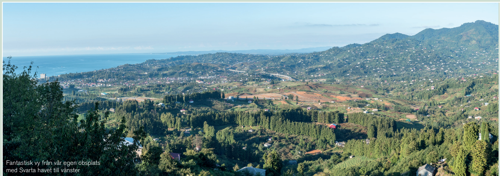
Fantastisk vy från vår egen obsplats med Svarta havet till vänster