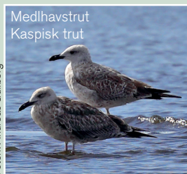
Medelhavstrut Kaspisk trut

Långnäbbad mås, 25 ex 27/9, 16 ex 29/9, 5 ex 30/9, 50 ex 1/10, allmän 2/10, 40 ex 3/10