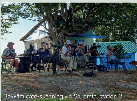
Bekväm café-skådning vid Shuamta, station 2