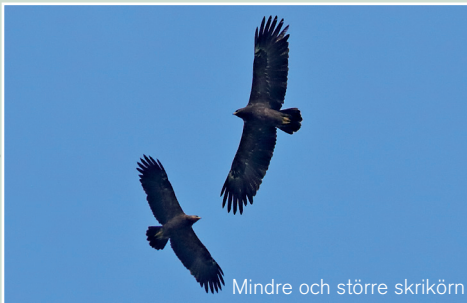
Mindre och större skrikörn

Svart stork, 33 ex 27/9, 421 ex 28/9, 22 ex 29/9, 16 ex 30/9, 3 ex 1/10, 1 ex 2/10, 24 ex 3/10 Skedstork, 50 ex 27/9, 22 ex 28/9 Gåsgam, 2 ex 29/9 Havsörn, 3 ex 30/9 Fiskgjuse, 1-3 ex 27/9-3/10 utom 30/9 Kejsarörn, 1 ex 29/9, 1 ex 1/10, 3 ex 3/10