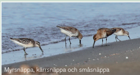
Myrsnäppa, kärrsnäppa och småsnäppa

Sandlöpare, 41 ex 30/9, 3 ex 1/10 Kärrsnäppa, 20 ex 20/9, 1 ex 1/10, 25 ex 3/10