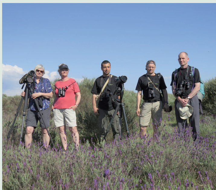
På spaning i "Sylvia" marker