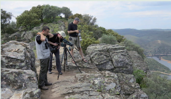
Uppe vid "the castle"