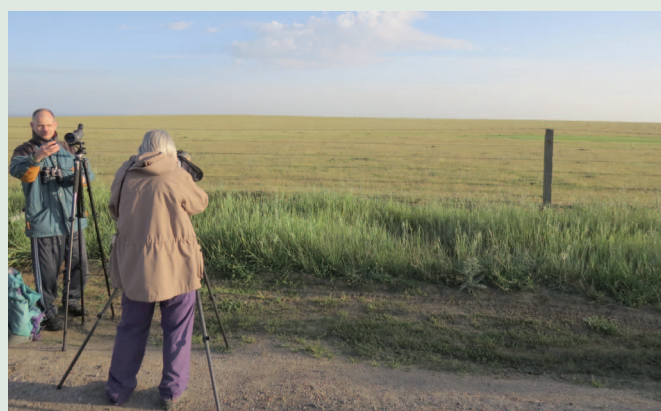
Spaning vid Trujillo