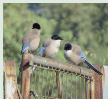
Blåskator på parad