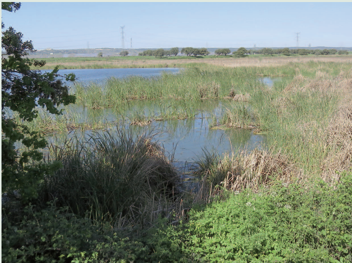
Embalse de Arrocampo