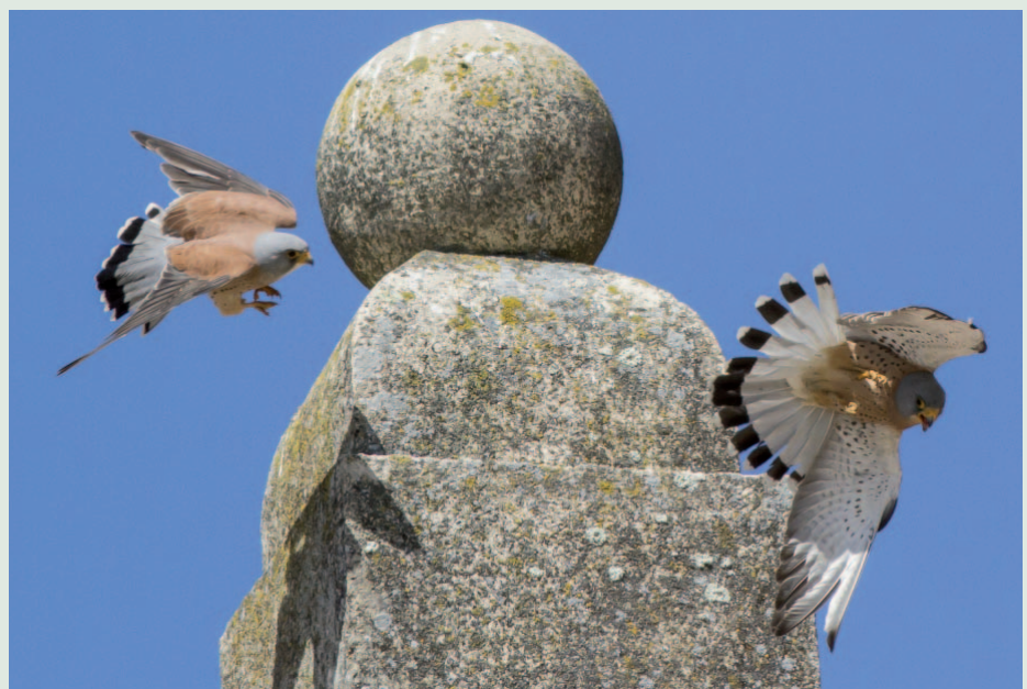
Rödfalkar i Sauce Dilla

Extremadura och Monfrague nationalpark, som är fullt av fåglar, representerar ett av Europas bästa ställen för fågelskådning, och är också ett ställe för några av Europas sällsyntaste och mest utsatta fågelarter.