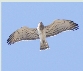
Dvärgörn över kullarna i Tarifa Ormörn