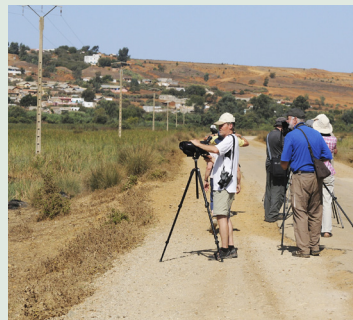
Skådning vid Lucos river