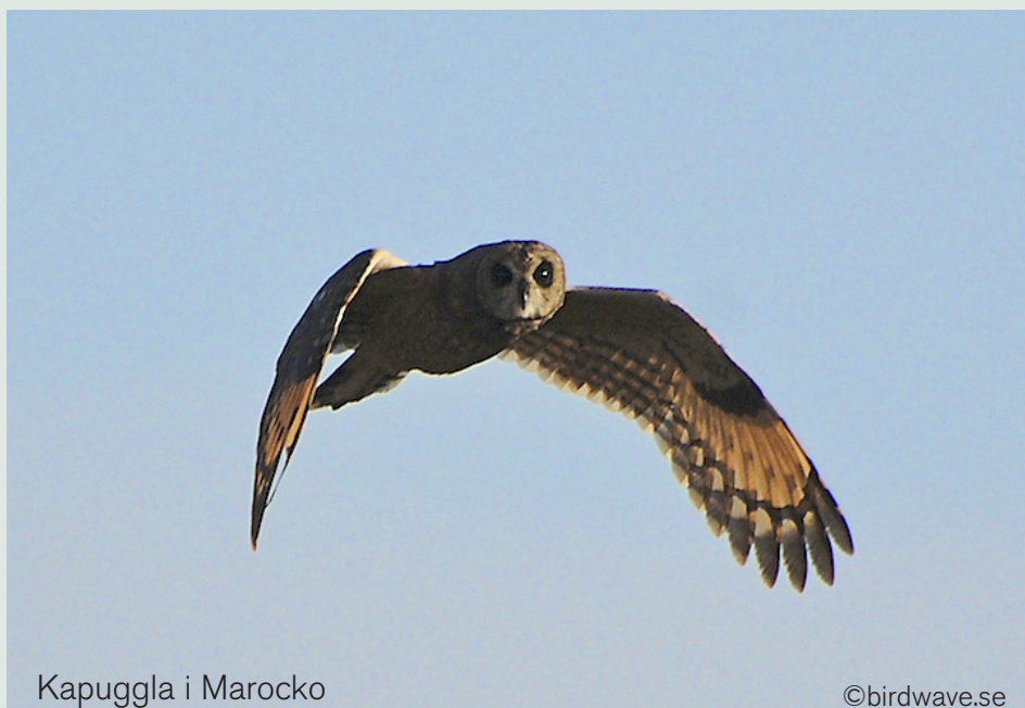
Kapuggla i Marocko

Södra Spanien och Marocko. Ett nytt sätt att studera det mäktiga sträcket vid Gibraltar Strait. Fantastiska dagar med rovfågel i Spanien. Oväntade möten i Marocko. Så annorlunda allt kan vara med bara ett sund mellan länderna.