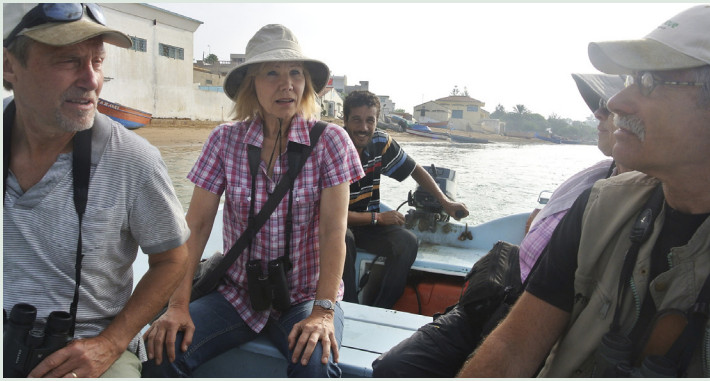
På väg ut i Merga Serga