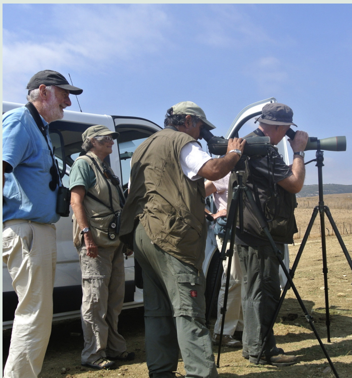
Den spansk-engelsk-amerikanska gruppen