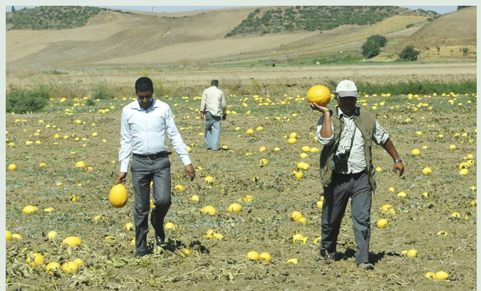
Meloninköp längs vägen