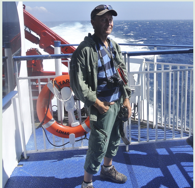
Båtresan erbjöd havsfågelskådning

23 september. Merga Serga-Campingplatsen. Frukosten som består av bröd, smör, marmelad och en liten omelett åt vi kl 08:00. Därefter åkte vi ut med båtar i våtmarken. Hassan the birdguide ledde den engelska gruppen och någon som jag inte vet namnet på körde vår båt. Hans svärmor eller mor knuffade ut båten och hans fru tog hand om barnet som absolut ville med. Ganska tidigt betedde han sig märkligt genom att dutta i lite bensin vid ett par tillfällen. När vi var halvvägs och hade skådat från en sandbank vägrade vår pilot att fortsätta.