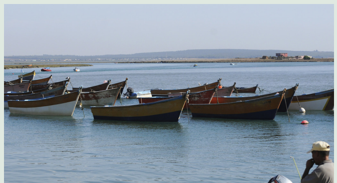
Hamnen vid Merga Serja