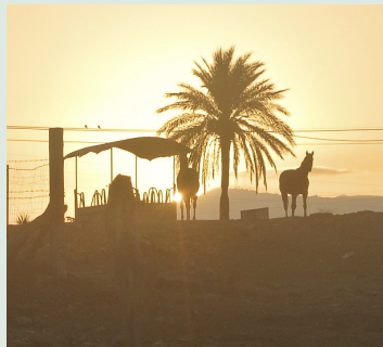
Soluppgång i Zahara Santunes