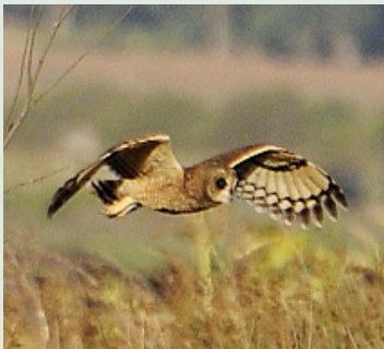
Kapuggla-mållart i Marocko