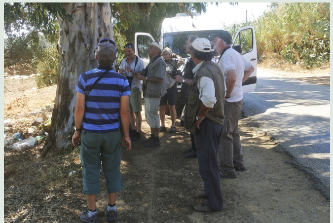
Här kollar vi resans första koboltmes