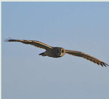
En av nio kapugglor