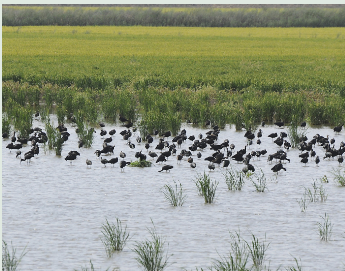
Bronsibisar i tusental