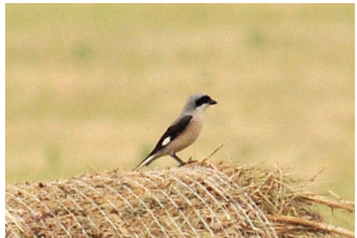
Svartpannad törnskata

Nästa stopp blev Szentisvan där vi vandrade ut på puztan där vi kunde se häckande Tatarfalk i en kraftledningsstolpe. Ungern hyser Europas största population av Tatarfalk och har gjort stora insatser för att öka beståndet. Att placera holkar högt upp i kraftledningsstolpar minskar risken för att äggen skall stjälas av äggjuvar. Vi noterade också två Minervaugglor på platsen och flera Blåkråkor.