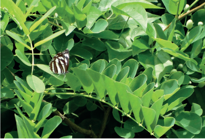
Neptis sappho

Hemresedag. Eftersom vi inte skulle åka till flygplatsen förrän kl 1300, så skjutsade bussen oss upp till en äng och sedan till ett kalhygge, vilka vi hade besökt tidigare. Vädret var mulet så fjärilarna hade svårt att komma igång, men vi fick i alla fall se ca 35 dagfjärilsarter. Den stora överraskningen visade sig en kvart innan bussen skulle transportera oss till flygplatsen. Då visade sig en Seglare ( Neptis sappho ) i trädgården på Farm Lator.